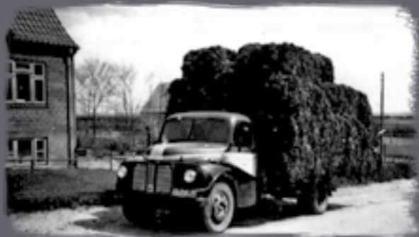
Lastbil med tang fra Virksund

Samtidig fungerer tanghuset som primitiv overnatningsmulighed, hvor vandrere, cyklister, sejlere og roere kan overnatte under tag.