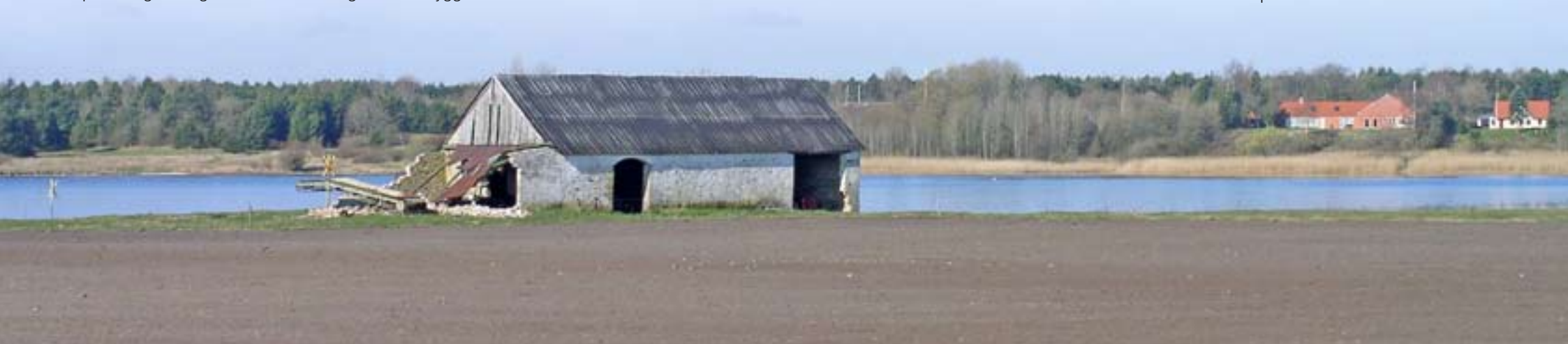
Det gamle tanghus i Sundstrup