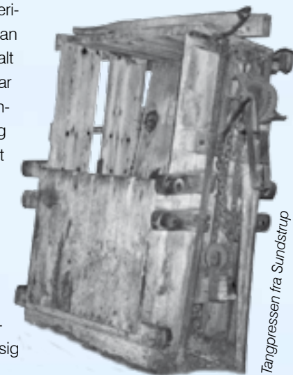
Tangpressen fra Sundstrup

på brød og kød. Derimod udvandt man omkring år 1800 salt af tang, da salt var uundværligt til konservering af kød og fisk. At udvinde salt af tang var dog en langsommelig proces med kogning og inddampning og uden det store udbytte. Så da saltprisen faldt, kunne det ikke betale sig mere.